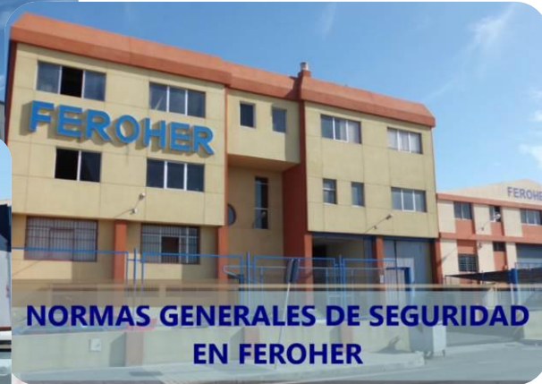
NORMAS GENERALES DE SEGURIDAD EN FEROHER