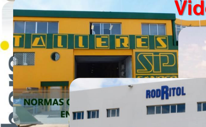
NORMAS GENERALES DE PREVENCIÓN EN TALLERES SP