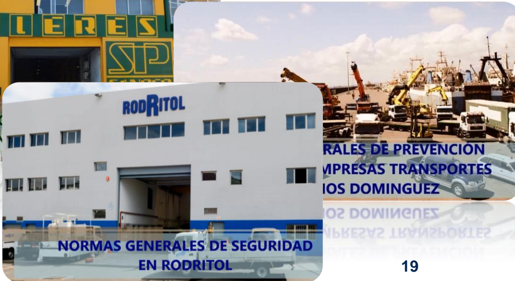
NORMAS GENERALES DE SEGURIDAD EN RODRITOL