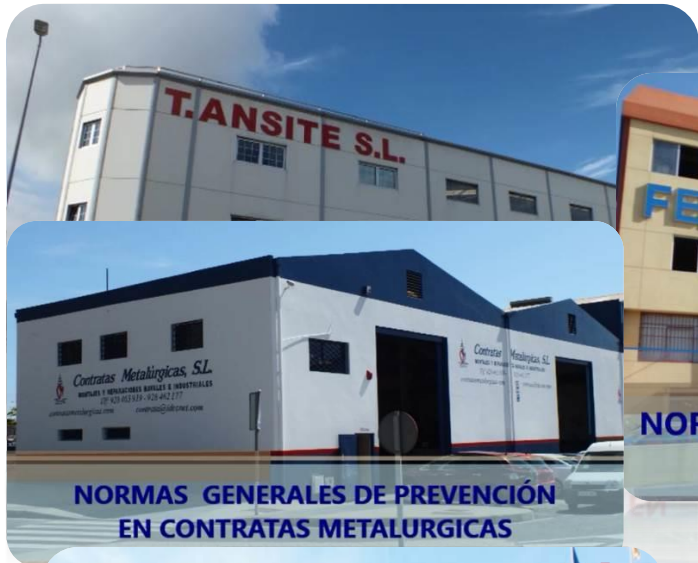
NORMAS GENERALES DE PREVENCIÓN EN CONTRATAS METALURGICAS