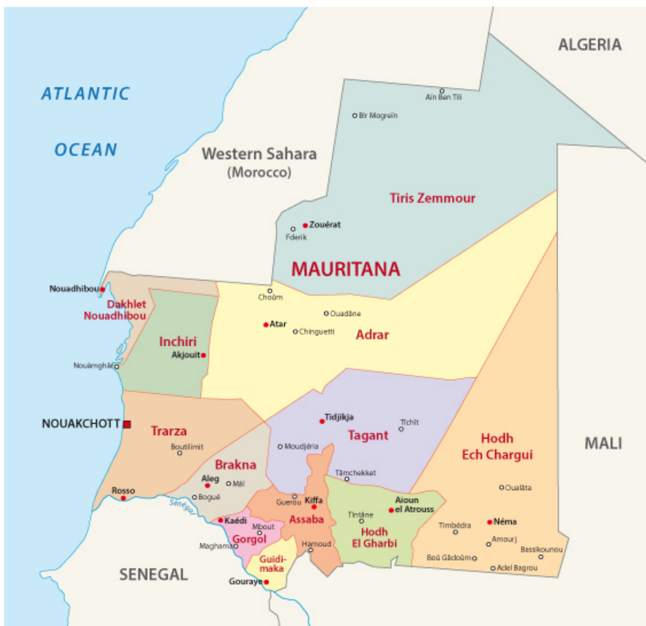
Mapa 4: División administrativa de Mauritania