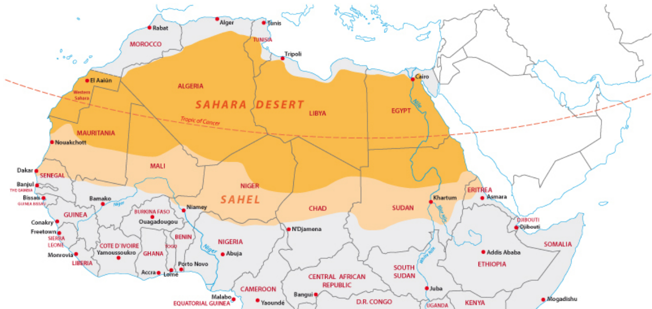
Mapa 1: El Sahel