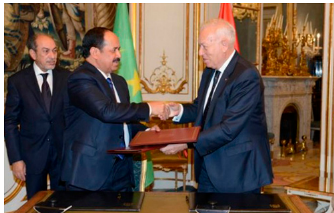
El entonces ministro de Asuntos Exteriores y de Cooperación, José Manuel García-Margallo, saluda a su anterior homólogo mauritano, Hamadi Ould Meimou, durante su visita a Madrid en noviembre de 2015.

España es un país de gran importancia económica para Mauritania, habiéndose consolidado en los últimos años entre los primeros socios tanto como importador como exportador. Concretamente, en 2017 nuestro país fue el 4º proveedor del país y tercero entre sus destinos de exportación. Por su lado, en 2017, último año completo disponible, Mauritania consiguió un volumen de exportación de 230.994,97$, un 59,9% más que en 2016. Considerando los datos de EUROSTAT para 2017, últimos datos disponibles, España ocupó el segundo puesto entre los proveedores de la UE (con un 17,6% de las exportaciones europeas); tras Francia. Las cantidades relativas a 2017 reflejan un aumento con respecto a 2016 situando sus cifras en 21,5% España. Por el lado de las importaciones, España se posiciona como primer cliente de Mauritania con un 50,3% en 2017, un 43,6% en